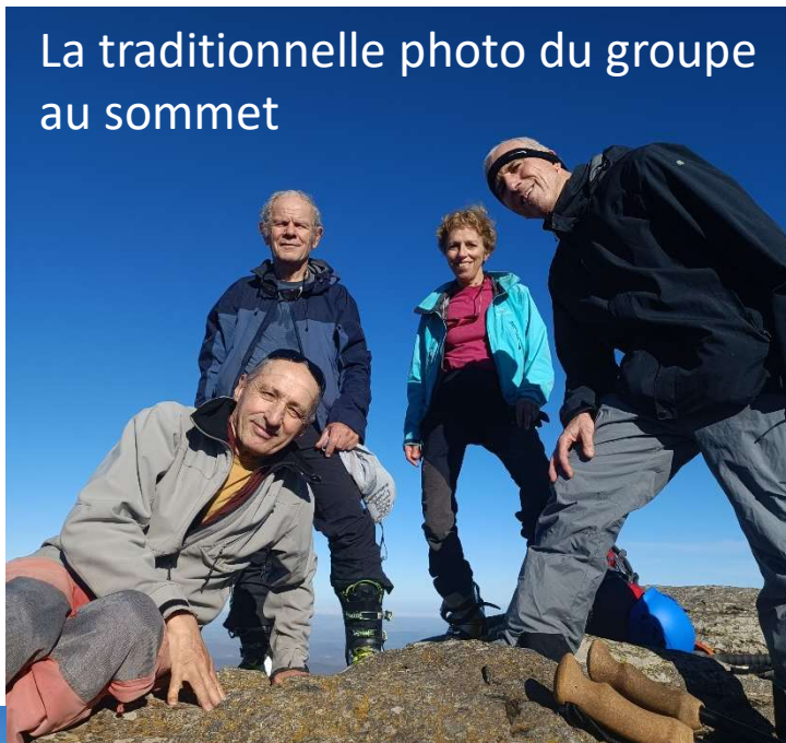
La traditionnelle photo du groupe au sommet