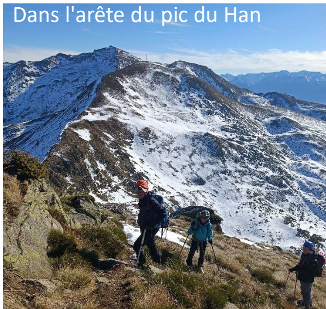
Dans l'arête du pic du Han